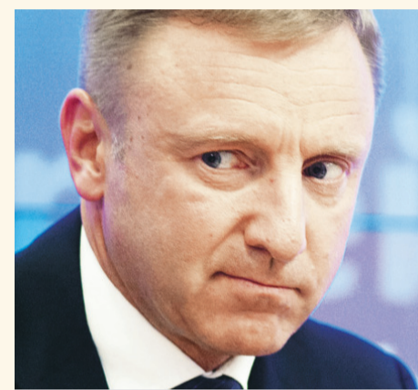
Реформа образования и министр Ливанов несостоятельны, считают в СР

В ближайшее время «Справедливая Россия» внесет законопроект, повышающий статус педагога и приводящий