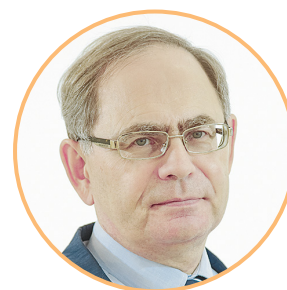
Руководитель калужского регионального отделения партии «СПРАВЕДЛИВАЯ РОССИЯ», доктор экономических наук Александр БЫЧКОВ

– В Калужской области на развитие здравоохранения в 2021 году будет направлено 10,324 миллиарда рублей. На обеспечение льготных категорий граждан лекарствами – 1,705 миллиарда. Будущее покажет, достаточно ли этих средств на восстановление медучреждений, повышение зарплат медикам и обеспечение лекарствами всех бедных в регионе. Предложение «Справедливой России» – увеличить эту цифру в два раза – до 3,4 миллиарда.