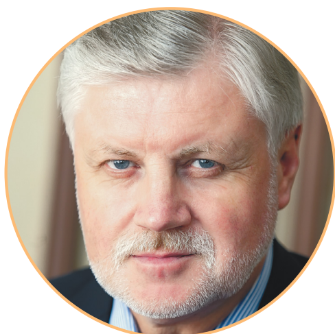
Миронов Сергей Михайлович Руководитель фракции в Госдуме

Команда «Справедливой России» имеет представительство в 10 районах Калужской области. Муниципальные депутаты – на страже ваших прав и интересов.