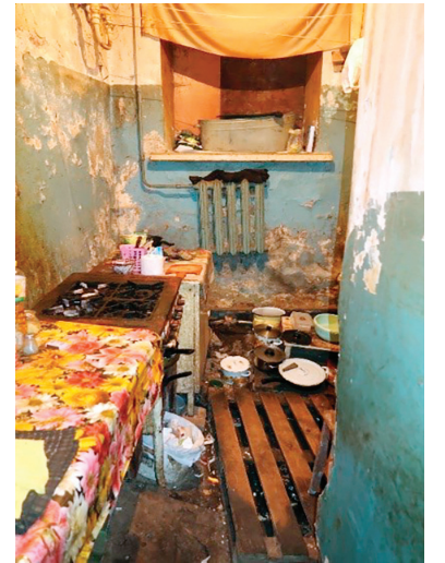
На фото: кухня коммунальной квартиры на первом этаже «никитинских трущоб».

дома. Сначала доверчиво-радостным калужанам твёрдо пообещали переселить их из опасного дома в 2016 году. Прошло три года мучений и ожиданий. К назначенному сроку люди собрали вещи, купили шампанского и взяли напрокат кота, чтобы пускать его в своё новое жилище. Горуправе не понравилась такая торопливость, и чиновники перенесли новоселье на 2018 год.