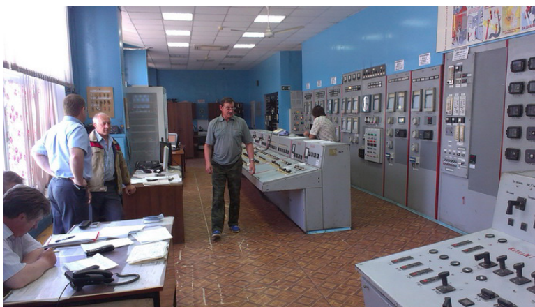
На фото: «командный пункт» МП «Теплоснабжение» доцифровой эпохи.

Руководство Калужской области поставило амбициозную задачу прорыва коммунального хозяйства региона в цифровую экономику. 1 марта в Обнинске заместитель министра строительства и ЖКХ Руслан Маилов подписал соглашение с ООО «Инфосистемы» по оцифровке ЖКХ. Начать решили с Обнинска – столицы Северной агломерации области. Одним из пионеров коммунальной цифровизации объявлено МП «Теплоснабжение».