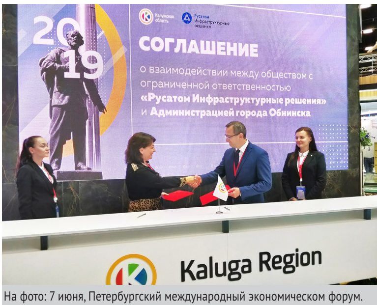
На фото: 7 июня, Петербургский международный экономическом форум.