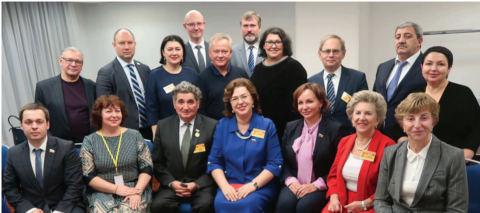
На фото: новый состав Совета Палаты депутатов СР