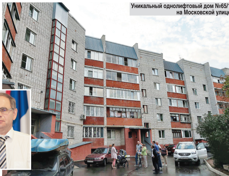
Уникальный однолифтовый дом №65/1 на Московской улице